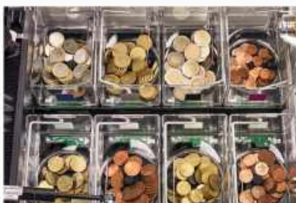
Cada moneda tiene su propio hopper Máxima fiabilidad y rapidez