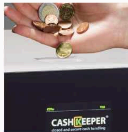
Acepta, valida, recicla y paga todas las monedas