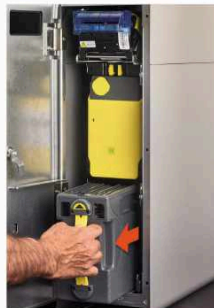
Recaudación de billetes en un módulo cerrado. Nadie ve ni toca el dinero