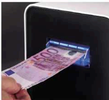
Acepta y verifica todos los billetes, incluyendo el de 500 €